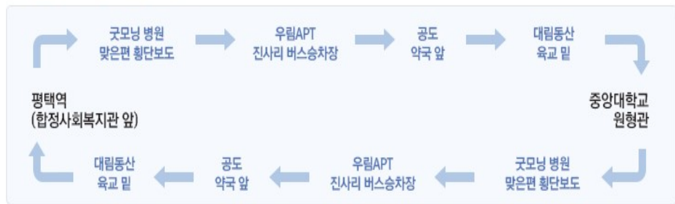
■ 안성캠퍼스↔평택역 순환버스 안내